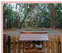
②祭場に社殿はなく離れた所から参拝します