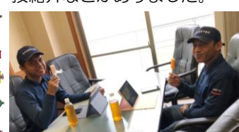
↑休憩中 アイを食べました

↑クイズに真剣に回答中の2人 豪華景品が当たる抽選会やインド初音研修施設の先生からメッセージもあり、参加賞は7カード5千円と豪華で、皆さんとても楽しんでましたよ