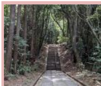
①参道の階段をのぼります

そのうちの一つ、辺津宮・高宮祭場は、本殿の脇から右へ15分くらい歩いたところにあります。ここは沖ノ島と並び宗像大社のなかで最も神聖な場所で宗像三女神の「市杵島姫神（イチキシマヒメ）」が天から最初に降臨したとされる場所で、知る人ぞ知るパワースポットです。今年の年末年始は8連休ですので、三社参りにぜひ行かれてみてください。