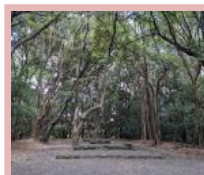
③岩や木々に神が宿るとされる古代祭場です