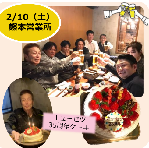
キューセツ 35周年ケーキ