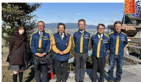
令和6年2月24日 安全祈願 高良大社参拝

2月24日（土）に高良大社にて新年の安全祈願を行いました。昨年を無事に過ごせたことへの感謝と、社員・会社が今年1年を健康安全に過ごせるよう祈願しました。