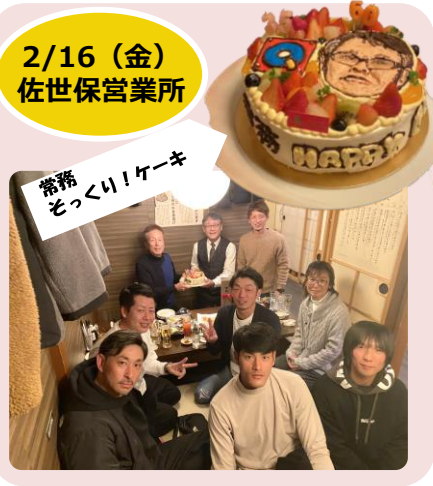
常務 ぞっくり！ケーキ