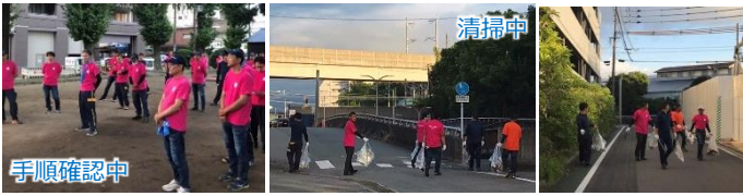
清掃作業後はそれぞれの作業場へ。参加者の皆さん、お疲れ様でした。